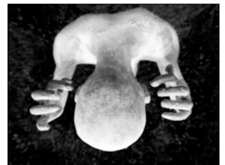
Ton Dirven - 10 pt