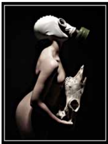
Raúl Neijhorst - 9 pt