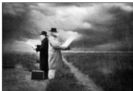
Harry de Rooij - 10 pt