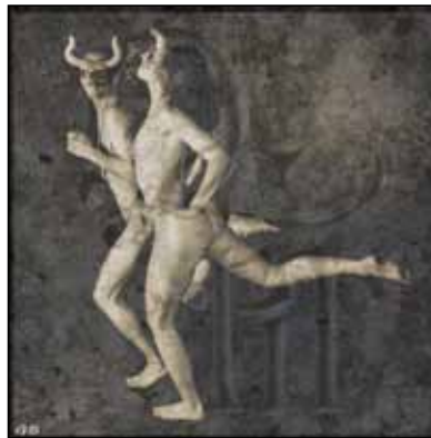
Gerrie Bodde - 11 pt